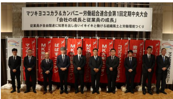
マツキヨココカラ&カンパニー労働組合連合会第1回定期中央大会 「会社の成長と従業員の成長」 従業員が自由闊達に知恵を出し合いイキイキと働ける組織風土と労働環境づくり